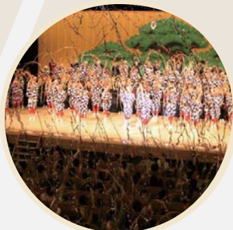
「千人の玉すだれ」 (浅草公会堂)