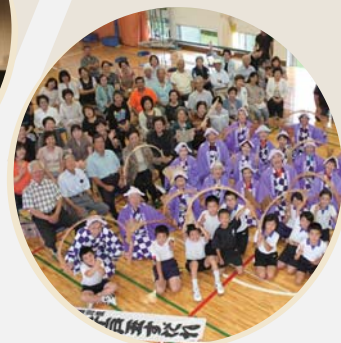
玉すだれ教室 (鹿児島県徳之島)