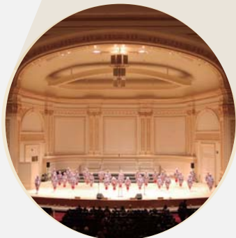
カーネギーホール公演